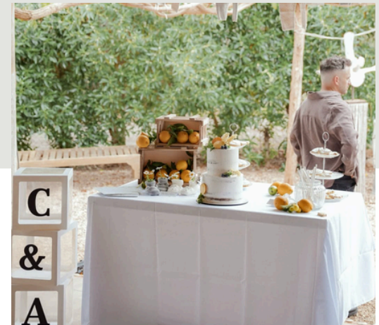
Baby Shower C&A x Sloewe IBIZA

Coordination de l'évènement pour le lieu Pandilla Ibiza : régie, respect des timings, installation des espaces, assistance des équipes et accueil des invités..