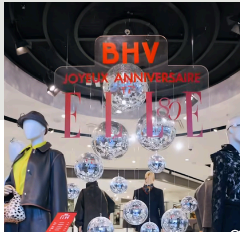
ÉVÈNEMENTS ELLE MAGAZINE PARIS

Coordination de l'évènement: régie, respect des timings, installations, assistance des équipes et prestataires, accueil des invités.