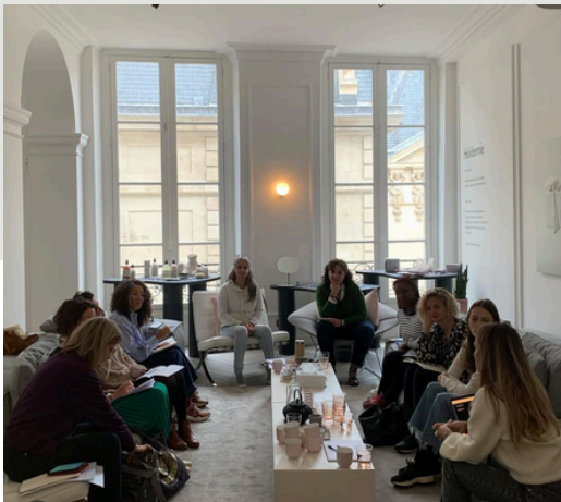
Retreat Day, Stones Club x Holidermie PARIS

Coordination de l'évènement: régie, respect des timings, installations, assistance des équipes et prestataires, accueil des invités.