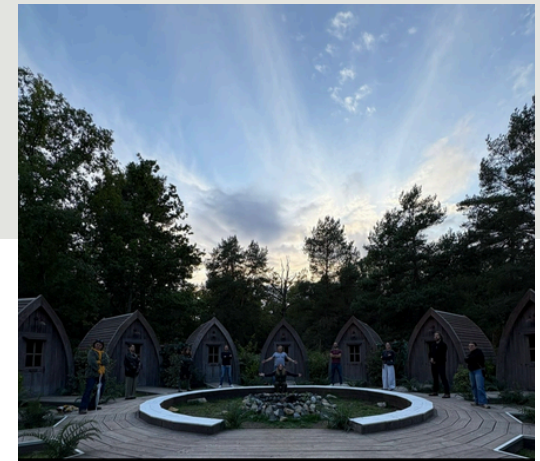
Jeu IRL, Kymono x Canal + PARIS

Coordination des évènements : régie, respect des timings, installations, assistance des équipes et prestataires partenaires, accueil des clients.