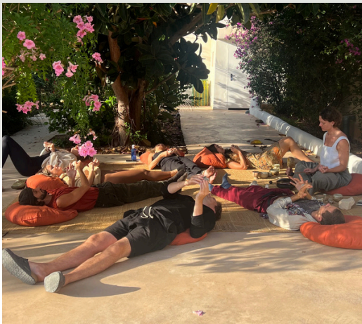
La Soul Experience Wellness Days IBIZA

Création du concept et gestion totale de l'événement : sourcing de clients et de prestataires, définition de l'univers visuel, scénographie, coordination logistique, montage, supervision et démontage.