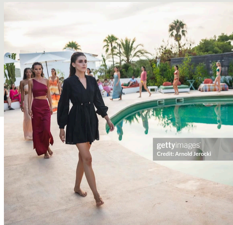
Défilé Oniriq Magazine IBIZA

Création du concept et gestion totale de l'événement : sourcing de clients et de prestataires, définition de l'univers visuel, scénographie, coordination logistique, montage, supervision et démontage.